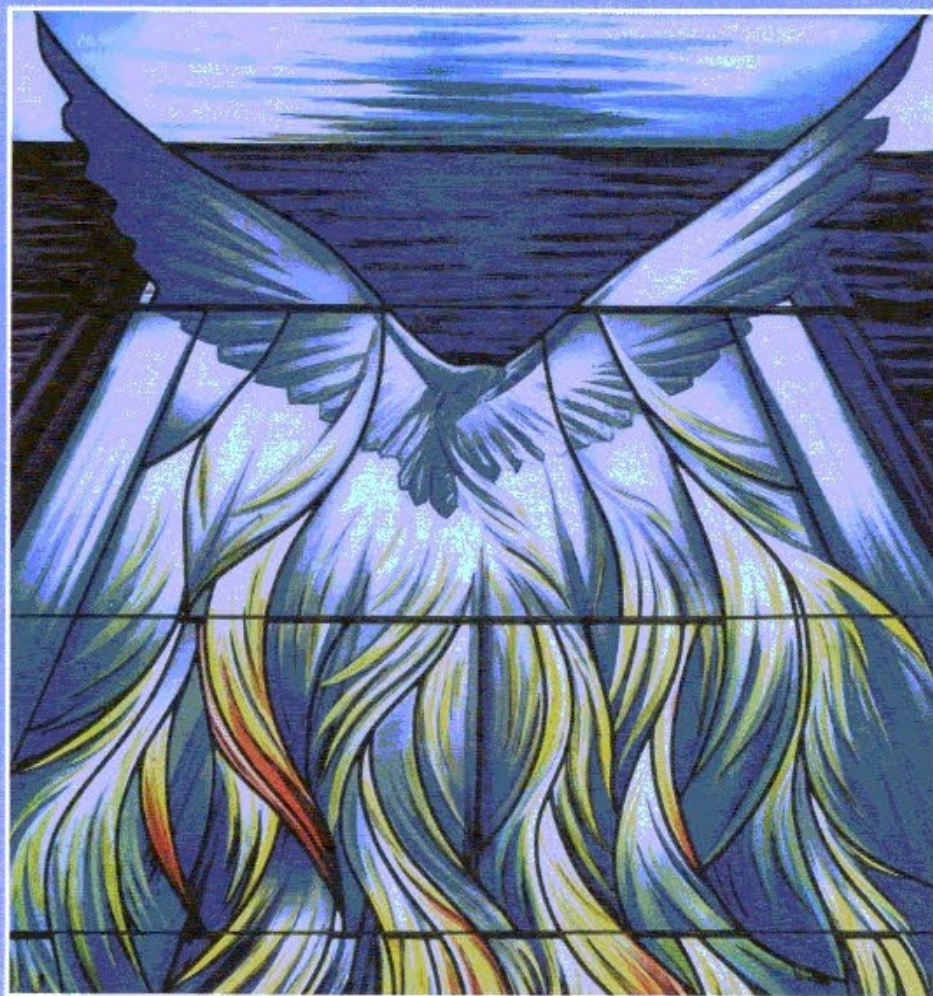
Geistsendung John K. Clark (geb. 1867; Glasgow/Wiesbaden/Taurusstein-Wehen, www.glasspainter.com ), Pfingsten, Glasfenster in St. Konrad, Amberg-Immersricht (Ostseite), Neues Testament, Detail 7